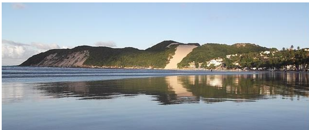
Morro do Careca, Praia de Ponta Negra